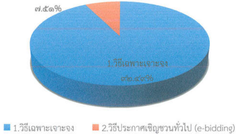
แผนภูมิแสดงร้อยละของจำนวนงบประมาณจำแนกตามวิธีการจัดซื้อจัดจ้าง 2.วิธีประกาศเชิญชวนทั่วไป (e-bidding)